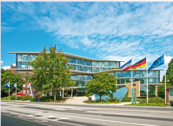
Das Haus der Wirtschaft, IHK zu Kiel

Nordlichter findet am 8. Juni 2018 von 10 bis 16 Uhr in Kiel im Haus der Wirtschaft, Bergstraße 2, statt. Danach sind alle Teilnehmer zum Networking eingeladen.